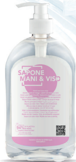
WHSM500D 500 ml - 16.907 fl.oz.