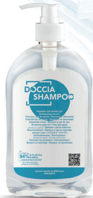
WHDS500D 500 ml - 16.907 fl.oz.