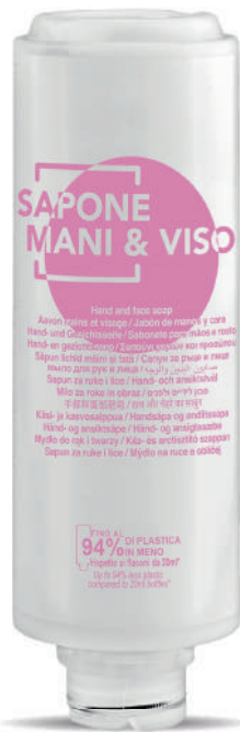
WHSM300C 300 ml - 10.1 fl. oz.