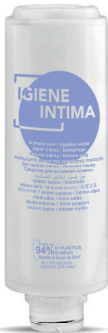
WHIG300C 300 ml - 10.1 fl. oz.