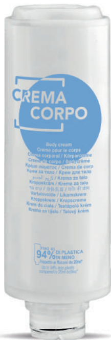
WHCC300C 300 ml - 10.1 fl. oz.