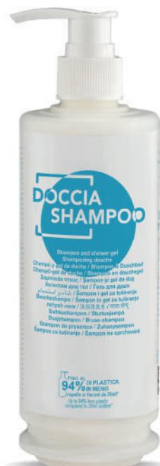
WHDS340D 340 ml - 11.49 fl.oz.