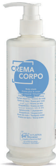
WHCC340D 340 ml - 11.49 fl.oz.