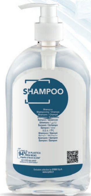
WSH500D 500 ml - 16.907 fl.oz.