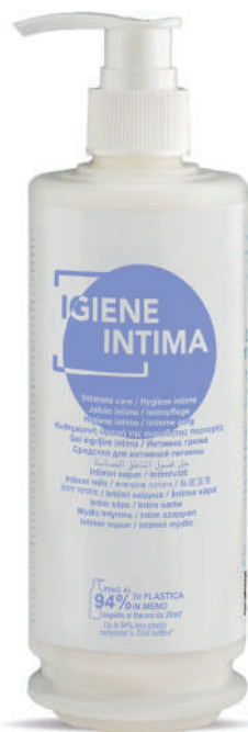
WHIG340D 340 ml - 11.49 fl.oz.