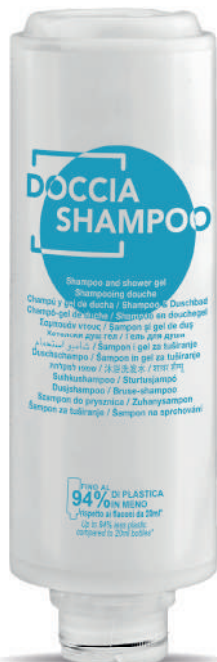
WHDS300C 300 ml - 10.1 fl. oz.