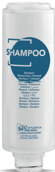
WSH300C 300 ml - 10.1 fl. oz.