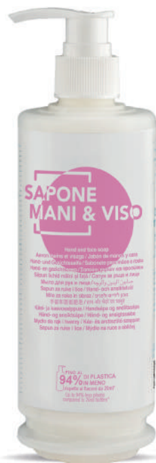
WHSM340D 340 ml - 11.49 fl.oz.