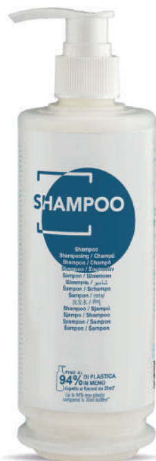
WSH340D 340 ml - 11.49 fl.oz.