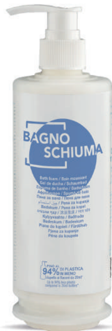
WHBS340D 340 ml - 11.49 fl. oz.