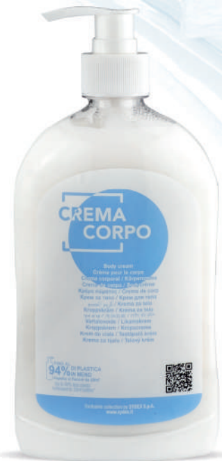
WHCC500D 500 ml - 16.907 fl.oz.