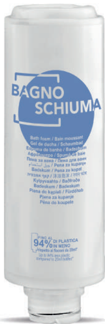
WHBS300C 300 ml - 10.1 fl. oz.