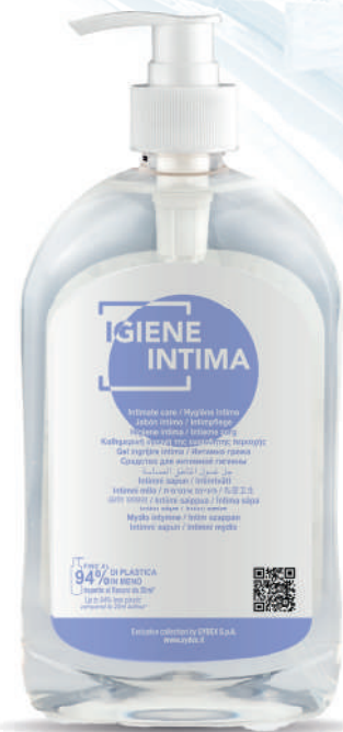
WHIG500D 500 ml - 16.907 fl.oz.