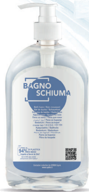
WHBS500D 500 ml - 16.907 fl. oz.