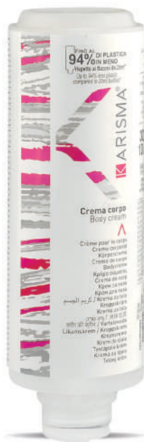
KRCC300C - 300 ml