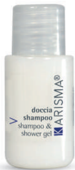
KRDS20F - 20 ml