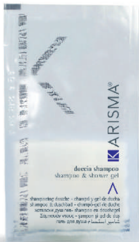
KRDS10 - 10 ml