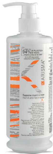
KRSM340D - 340 ml