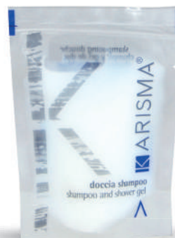
KRDS20 - 20 ml