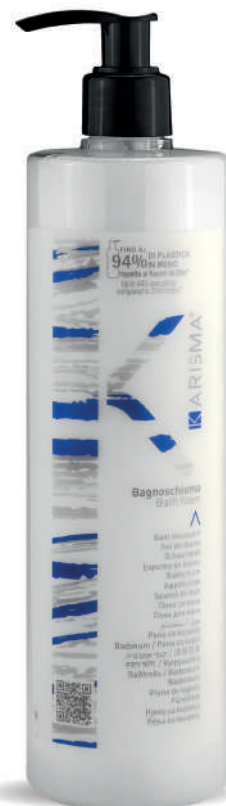
KRBS500D - 500 ml