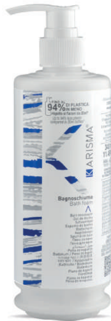
KRBS340D - 340 ml