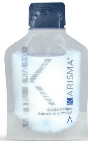
KRDS30 - 30 ml