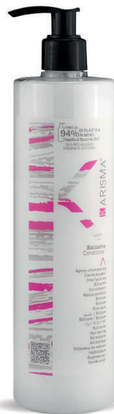
KRBL500D - 500 ml