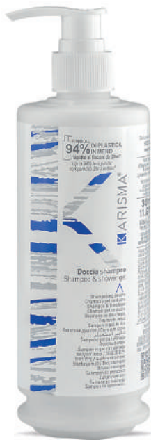
KRDS340D - 340 ml