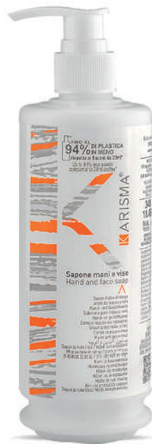
KRSH340D - 340 ml