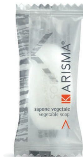
KRSR14FP - 14 g