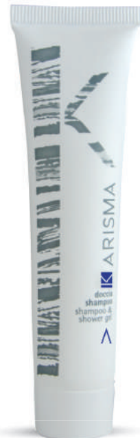
KRDS40T - 40 ml