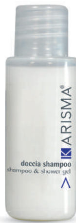
KRDS30F - 30 ml