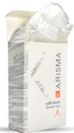
KRCDFP - Flowpack