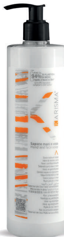
KRSM500D - 500 ml