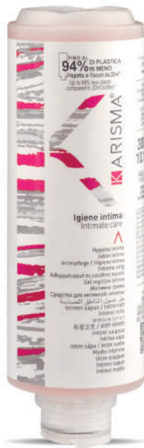
KRIG300C - 300 ml