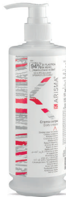
KRCC340D - 340 ml