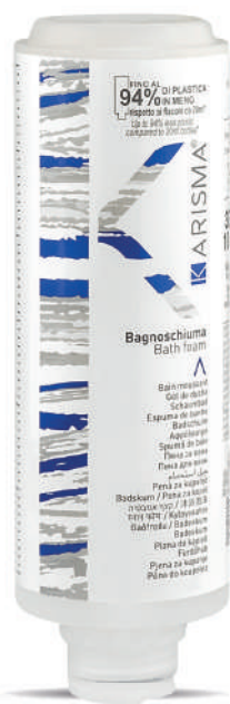
KRBS300C - 300 ml