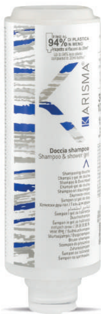
KRDS300C - 300 ml