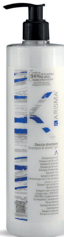
KRDS500D - 500 ml