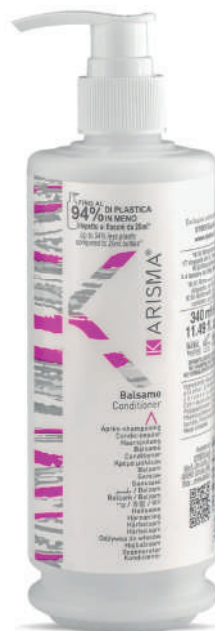
KRBL340D - 340 ml