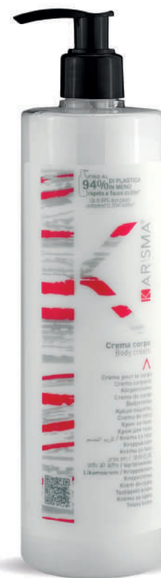
KRCC500D - 500 ml