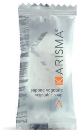
KRS09FP - 9 g