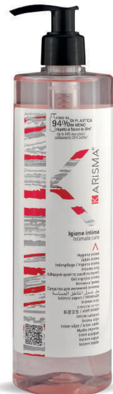
KRIG500D - 500 ml