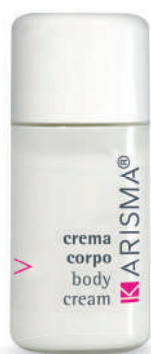
KRCC20F - 20 ml