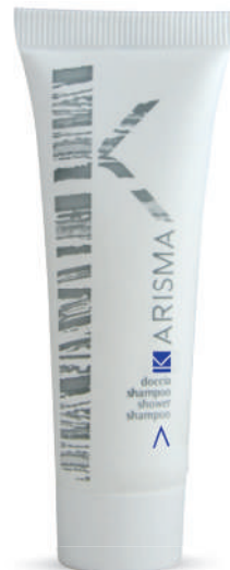
KRDS30T - 30 ml