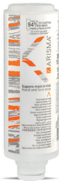
KRSH300C - 300 ml