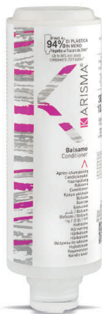
KRBL300C - 300 ml