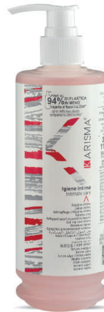
KRIG340D - 340 ml