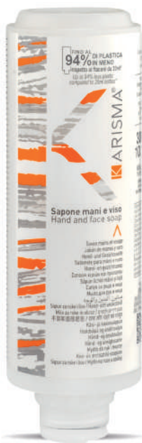
KRSM300C - 300 ml