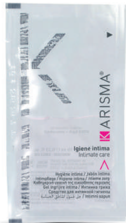
KRIG10 - 10 ml