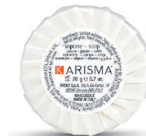
KRSP20PL - 20 g