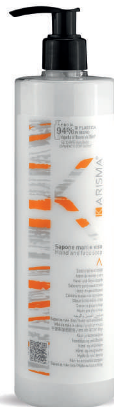
KRSH500D - 500 ml