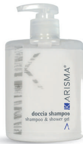
KRDS500F - 500 ml