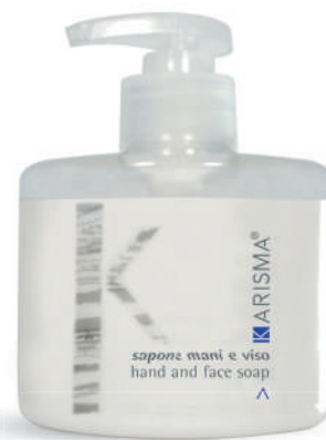
KRSM300F - 300 ml