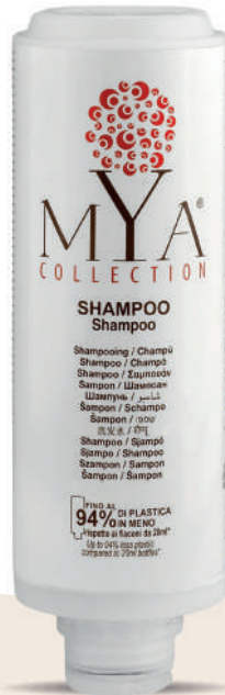
MYSH300C 300 ml - 10.1 fl. oz.