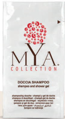
MYDS10 10 ml - 0.33 fl. oz.