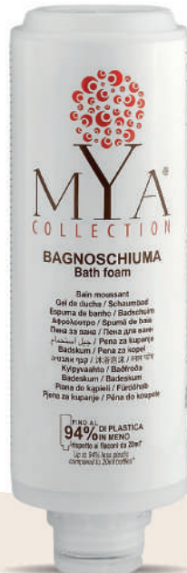
MYBS300C 300 ml - 10.1 fl. oz.