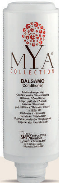
MYBL300C 300 ml - 10.1 fl. oz.