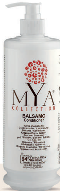
MYBL340D 340 ml - 11.49 fl. oz.