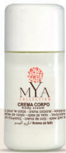
MYCC20F 20 ml - 0.67 fl. oz.