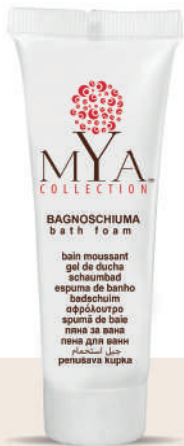
MYBS30T 30 ml - 1.01 fl. oz.