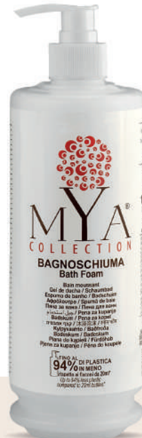
MYBS340D 340 ml - 11.49 fl. oz.