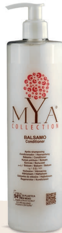
MYBL500D 500 ml - 16.907 fl. oz.