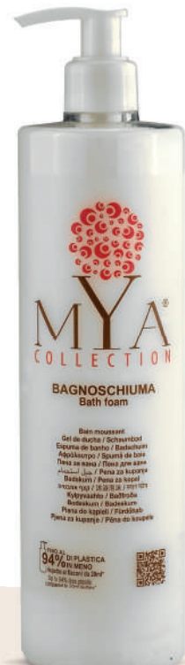
MYBS500D 500 ml - 16.907 fl. oz.