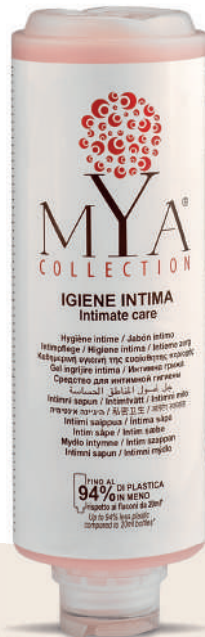
MYIG300C 300 ml - 10.1 fl. oz.