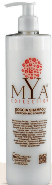
MYDS500D 500 ml - 16.907 fl. oz.