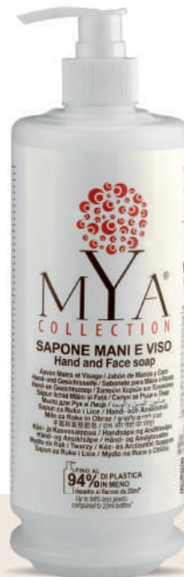
MYSM340D 340 ml - 11.49 fl. oz.