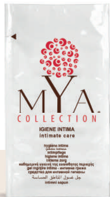
MYIG10 10 ml - 0.33 fl. oz.