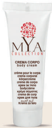
MYCC30T 30 ml - 1.01 fl. oz.