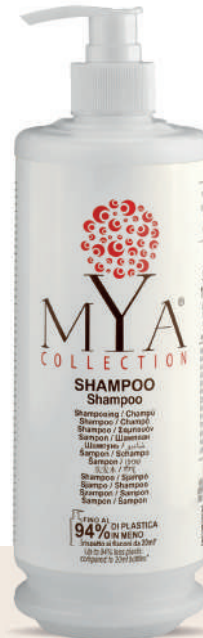
MYSH340D 340 ml - 11.49 fl. oz.