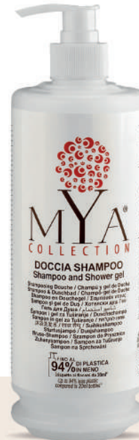
MYDS340D 340 ml - 11.49 fl. oz.