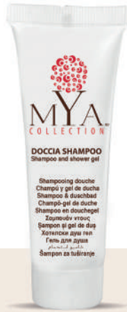
MYDS30T 30 ml - 1.01 fl. oz.