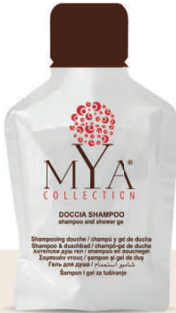
MYDS30 30 ml - 1.01 fl. oz.