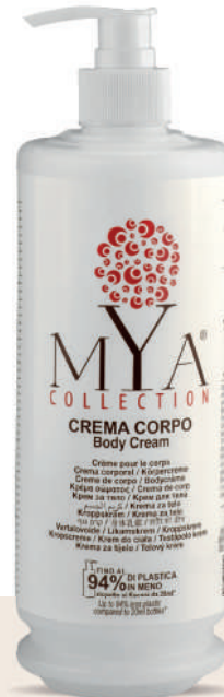
MYCC340D 340 ml - 11.49 fl. oz.