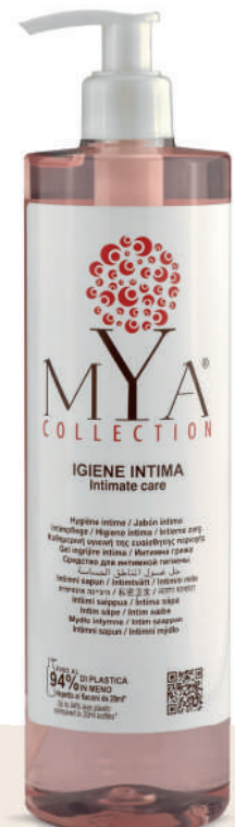
MYIG500D 500 ml - 16.907 fl. oz.

MYA COLLECTION IGIENE INTIMA Intimate care