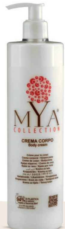
MYCC500D 500 ml - 16.907 fl. oz.