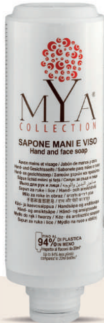
MYSM300C 300 ml - 10.1 fl. oz.