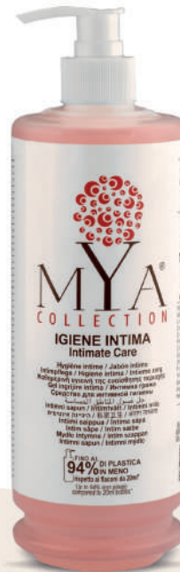
MYIG340D 340 ml - 11.49 fl. oz.