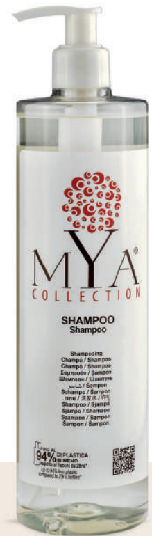
MYSH500D 500 ml - 16.907 fl. oz.