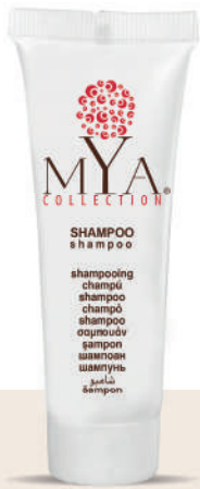
MYSH30T 30 ml - 1.01 fl. oz.