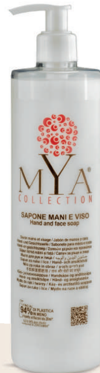
MYSM500D 500 ml - 16.907 fl. oz.