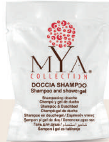
MYDS20 20 ml - 0.67 fl. oz.