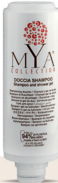
MYDS300C 300 ml - 10.1 fl. oz.