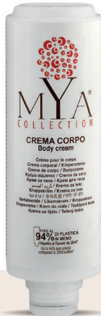
MYCC300C 300 ml - 10.1 fl. oz.